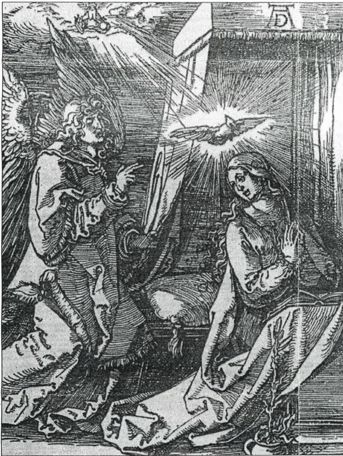
Albrecht Dürer: Navještenje

Nemojte se zavaravati, gospođo Grünfelder. Ni vjera čuvenoga filozofa, fizičara i matematičara Blaisea Pascala, autora tzv. kladenja na Boga, nije proizvod njegova mozga. I ona je nikla u srcu, hraneći se Pascalovom osjećajnošću, samo što je ta osjećajnost (kako reče André Gide) "bila snažna kao misao"