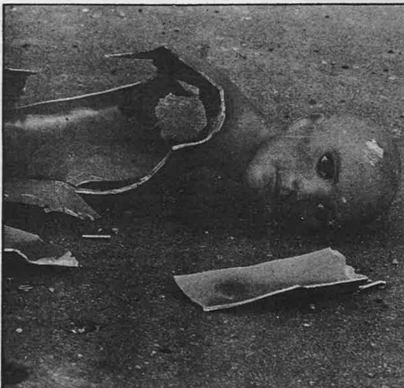
»Ranjena lutka-maneken na pločniku ratnoga Sarajeva