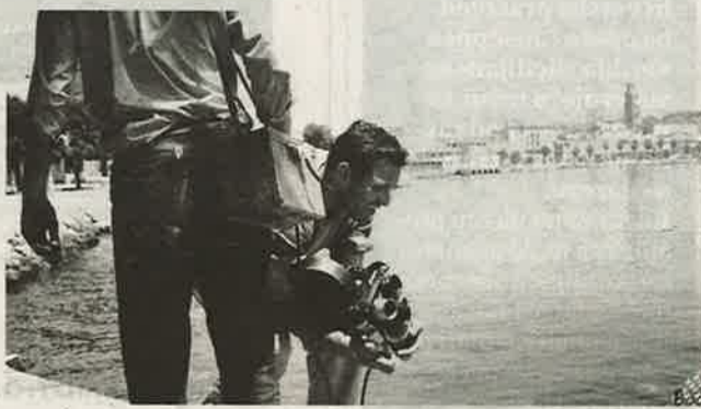
Martinac na snimanju svog eksperimentalnog filma 'Fokus'

Ivan Martinac je uz Mihovila Pansinija i Tomislava Gotovca najvažnije ime hrvatskog modernizma, nastalog u okvirima eksperimentalnog filma. Dokumentarac Zdravka Mustaća o tome vrlo poticajno svjedoči i zbog toga zaslužuje iznimnu gledanost. ●