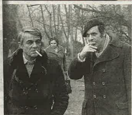
Fotografija sa seta i scena iz filma 'Kuća na pijesku' iz 1986. koji je zbog osebujna autorskog izričaja jedva prikazivan u kinima, (gore i lijevo); Prizor iz filma 'Fokus' iz 1967. godine