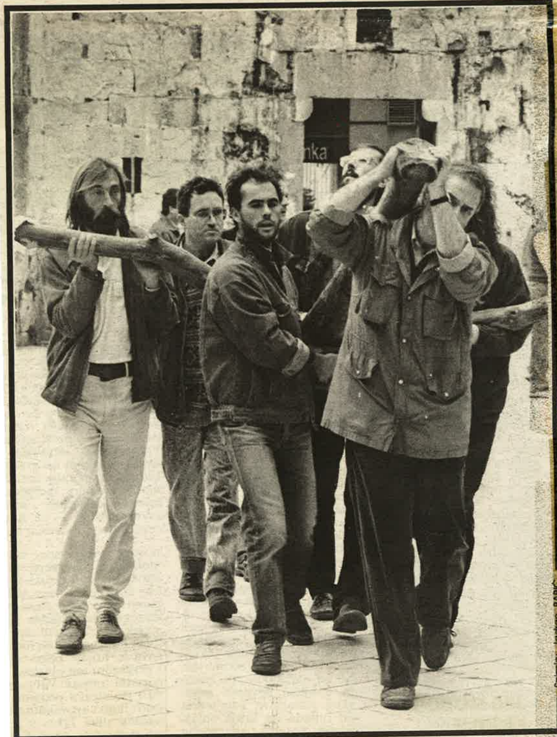
Sedmorica iz kino-kluba Split 23. listopada 1989. godine nose suhu trešnju (križ) od Čapove ulice do Ulice Petra Krešimira, hrvatskog kralja

21. siječnja (a bila je subota) imao sam već napisanu »primjedbu« i to ne na